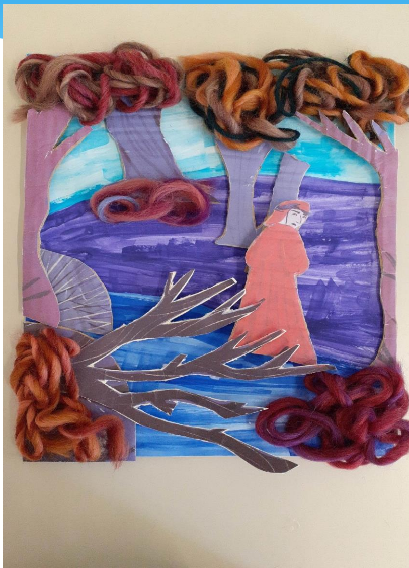
Tavola canto I